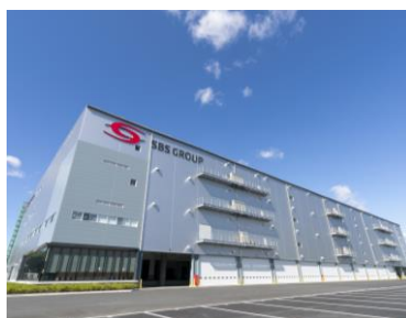
物流センター横浜金沢

開発コンセプトは「自動化・省人化・省スペース化」。当社の強みであるLT（Logistics Technology）とIT（Information Technology）を駆使し、最新・最先端のシステムやマテハン設備を設計・開発しました。従来の保管機器と比較して3倍以上の収納力を持つロボットストレージシステム「オートストア」を2基採用するほか、デジタルピッキングシステムの拡充、自動梱包機、シャトルラックなど自動化設備を随所に取り入れております。また、AI・ビッグデータを活用したサポートシステムとの融合により、自動化・省人化の追求と保管効率の向上を実現します。